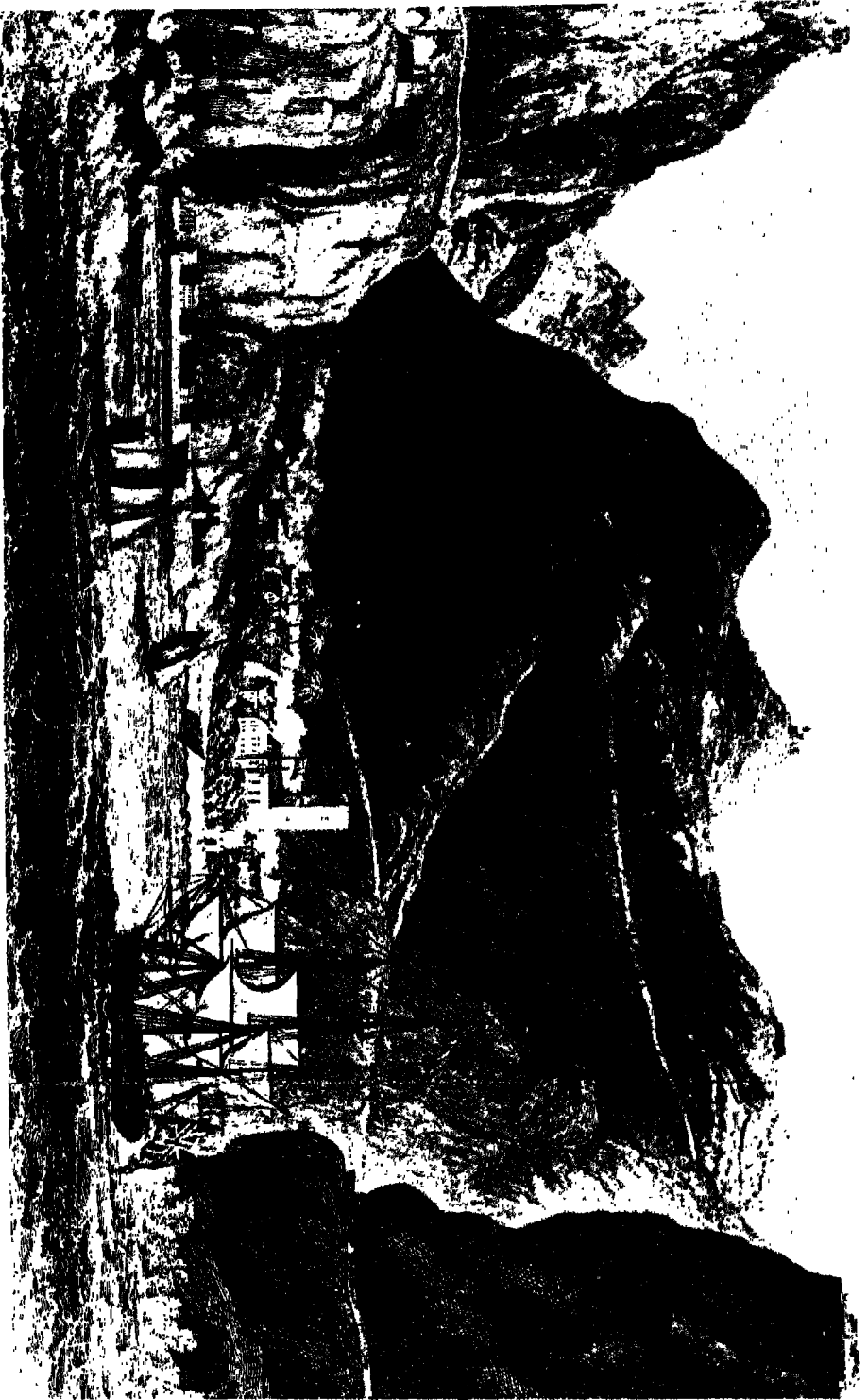
منظر عام لجزيرة سانت هيلين، وريثاء جيمس تاون.